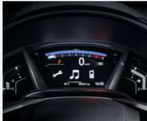
Painel digital de 7" em TFT de alta resolução

Surpreenda-se com a excelência desse SUV a cada pequeno detalhe como o botão de partida do motor e o freio de estacionamento eletrônico que podem ser acionados com um simples toque.