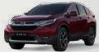
Basque Red Pearl