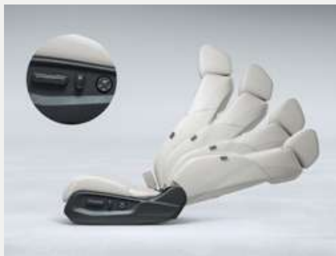
Bancos com ajustes elétricos