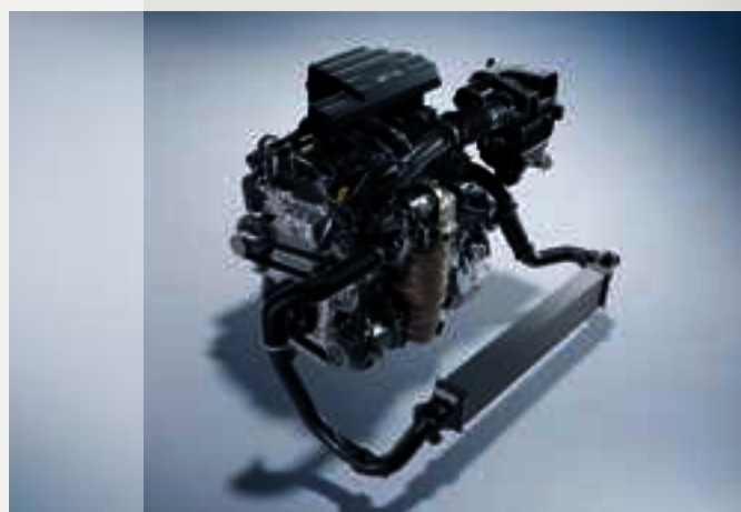
Motor 1.5l Turbo de 190 cv

O Novo Honda CR-V conta ainda com direção elétrica progressiva , comandos ao alcance das mãos como os Paddle shifts e o piloto automático (Cruise Control) para você sentir o máximo prazer de dirigir.