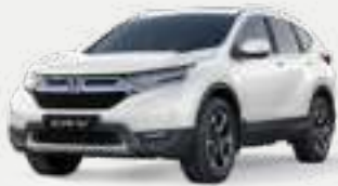
White Diamond Pearl