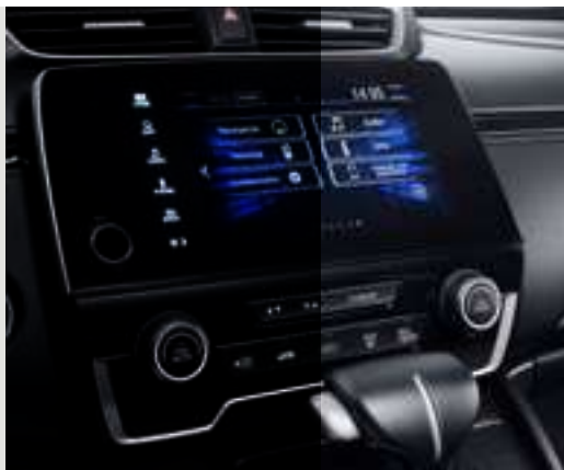
Multimídia de 7" multi-touchscreen com interfaces para smartphones