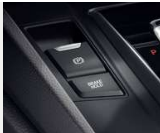
Freio de estacionamento eletrônico com função Brake Hold