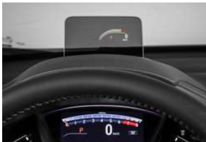
Visor Head Up Display

Conte também com o auxílio do visor Head Up display para visualizar as informações da condução e do navegador sem tirar os olhos da pista e do sistema de redução de pontos cegos Honda LaneWatch™ . Já o assistente de saída em rampas HSA , os sensores de estacionamento e o monitoramento de pressão dos pneus garantem maior conforto para sua condução.