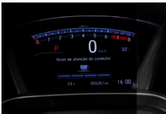
Sistema de monitoramento de atenção

O Novo Honda CR-V garante mais tranquilidade e proteção para você e sua família através de seus sistemas inteligentes. O assistente de dirigibilidade ágil (AHA) , combinado com o sistema de tração e estabilidade VSA , garantem respostas mais precisas e equilibram automaticamente a correção de desvios da condução em situações que necessitam de maior estabilidade. Para uma viagem mais segura, o sistema de monitoramento de atenção do motorista gera alertas visuais, sonoros e leves vibrações ao identificar comportamentos de condução que sugerem maiores níveis de cansaço e desatenção.