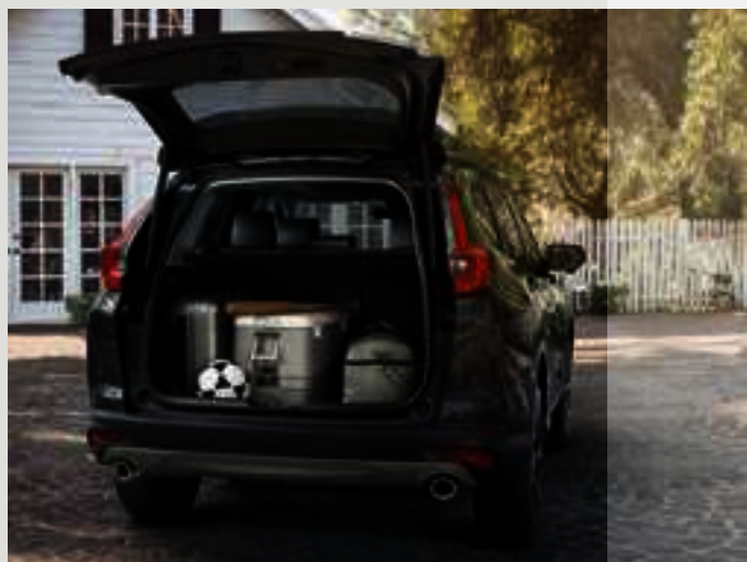
Porta-malas de 522 litros (até 1084l com rebatimento de bancos)

O console central com porta-objetos modular de fácil acesso e o amplo porta-malas de 522 litros (expansível até 1084l com rebatimento dos bancos) acompanham seu ritmo a bordo do Novo Honda CR-V .