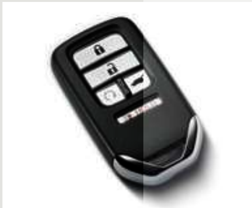
Smart Key com comandos inteligentes