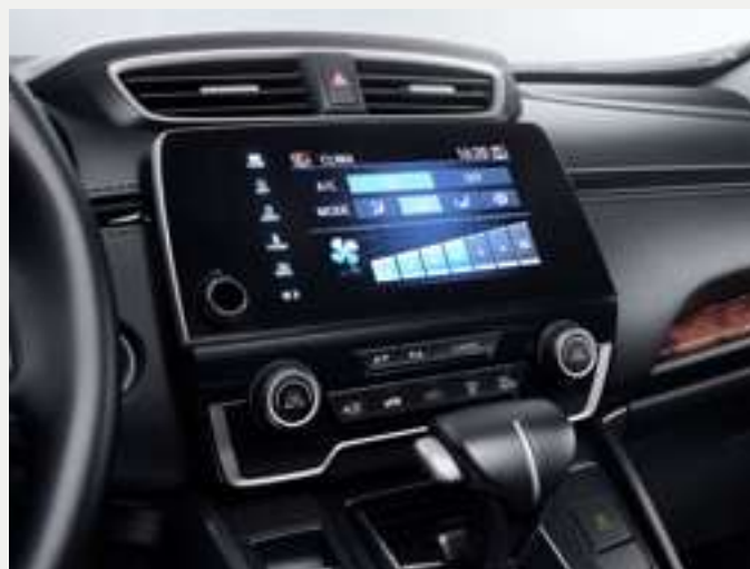
Ar-condicionado digital dual zone