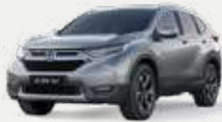
Lunar Silver Metallic